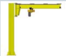
Søjlesvingkran type 3 – søjlehøjde 3000, 3500, 4000 og 4500 mm