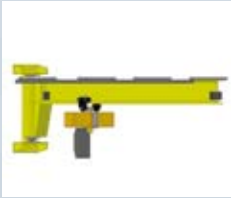
Vægsvingkran type 2