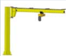
Søjlesvingkran type 2 – søjlehøjde 3000, 3500, 4000 og 4500 mm