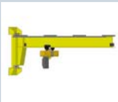
Vægsvingkran type 3