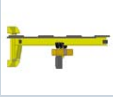
Vægsvingkran type 1