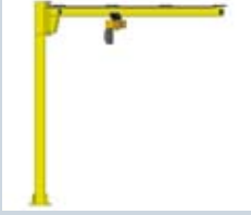
Søjlesvingkran type 1 – søjlehøjde 3000, 3500 og 4000 mm